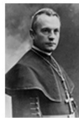
Prohászka Ottokár összegyűjtött munkái

>Mitől rengett a föld Haitin? >Sztrájkok >90 éves az Apponyi-beszéd >... most pedig nevsünk egy kicsit 3 ... >Kik fizetik az MSZP hiénakampányát?