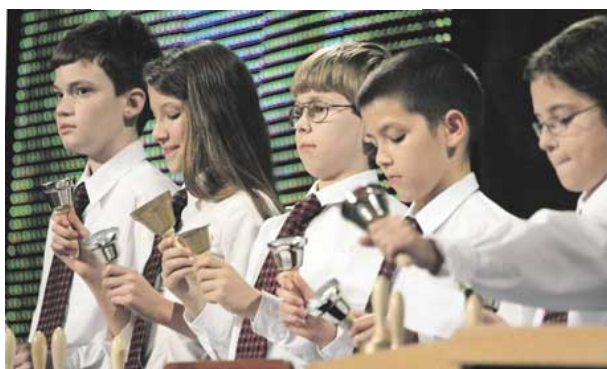
A díjazottakat a miskolci Kisharang együttes köszöntötte

Először adták át pénteken a Prima Primiissima Alapítvány és három társalapító, az MKB Bank, az MFB Rt. és a Vodafone által létrehozott Junior Prima Díjakat. A Prima Primiissima Díj junior változata, amely hétezer euróval jár, olyan harminc év alatti kutatókat, tanárokat, és sportolókat kíván jutalmazni, akik fiatal koruk ellenére kimagasló teljesítményt nyújtanak.